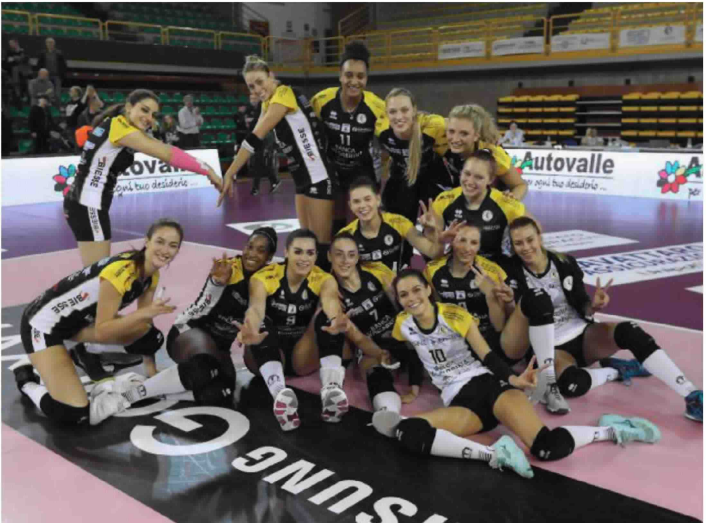
Un'immagine storica: le ragazze della Banca Valsabbina Millenium Brescia dopo la prima vittoria in A1