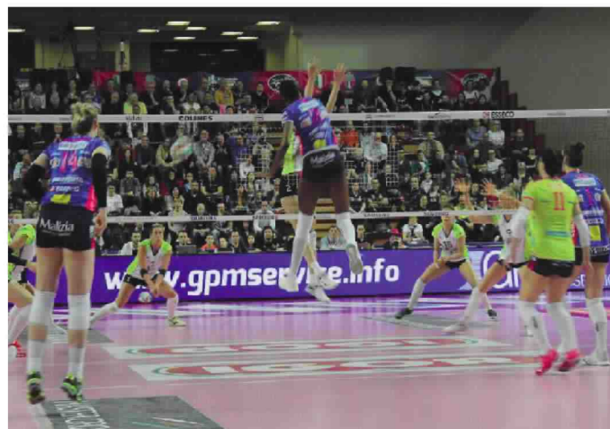
TOP SCORER CON 27 PUNTI Un attacco in pipe di Paola Egonu